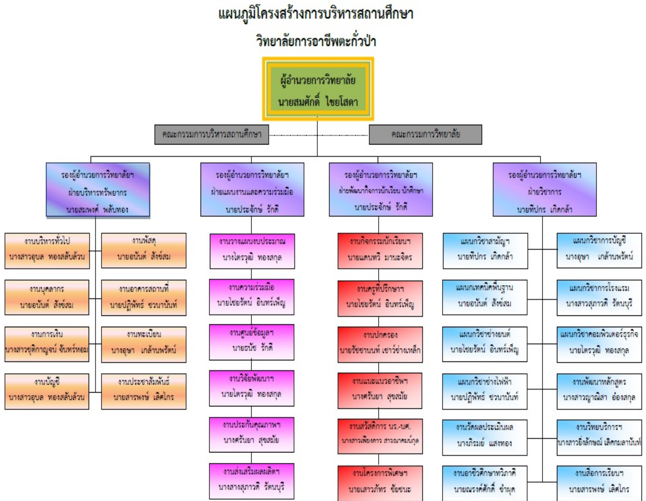
รูปที่ ๒.๑ แผนภูมิโครงสร้างการบริหารสถานศึกษา